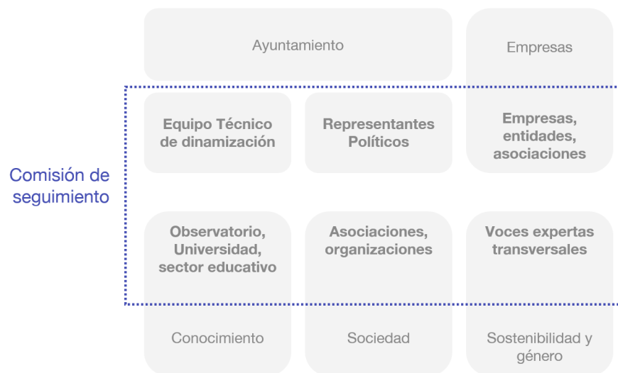
Composición de la mesa de seguimiento. Elaboración propia.

Será presidida por el/la Alcalde/sa y estará participada por las concejalías que se determine, así como por personal técnico y por actores que garanticen la diversidad de perspectivas transversales con la que interesa contar: género e igualdad, sostenibilidad, innovación, sector asociativo y empresarial. Entre ellos podría contarse con entidades o dispositivos como el Centro de la Mujer; asociación de empresarios; fundaciones; asociaciones de mujeres, de jóvenes, o de corte ambientalista; o voces expertas del campo académico o científico en materia ambiental y climática.